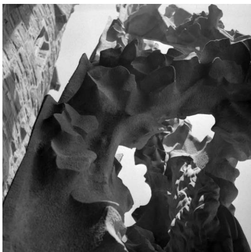
Detall del coronament de la llanterna de la Fe del Temple de la Sagrada Família, 1946.