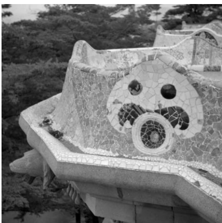
Joaquim Gomis. Detall del trencadís de la barana del banc de la plaça del Park Güell , 1946. Fons Joaquim Gomis, dipositat a l'Arxiu Nacional de Catalunya.