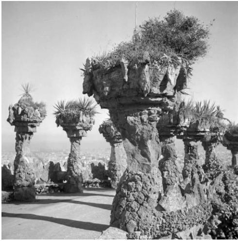
Joaquim Gomis. Vista d'un camí amb columnes jardineres del Park Güell , 1946. Fons Joaquim Gomis, dipositat a l'Arxiu Nacional de Catalunya.