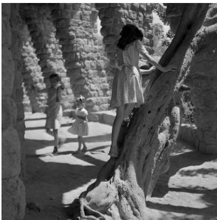
Joaquim Gomis. Nena pujant al tronc d'un arbre situat a l'interior d'un dels Viaductes del Park Güell , 1946,