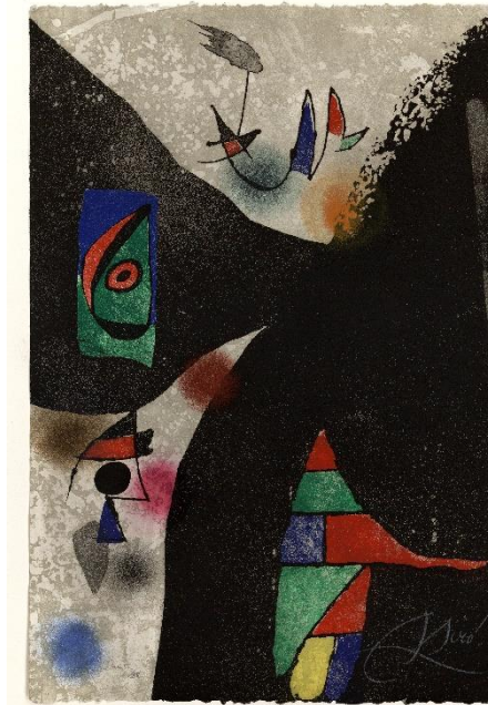
Joan Miró. Gaudí II , 1979. Fundació Joan Miró, Barcelona.