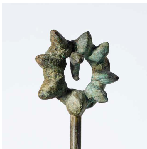
Joan Miró. Dona sol, 1966 (detall). Fundació Joan Miró, Barcelona.

Fons Joaquim Gomis, dipositat a l'Arxiu Nacional de Catalunya.