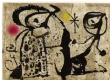
Joan Miró. Estela de doble cara , 1956, i Gaudí XIX , 1979. Fundació Joan Miró, Barcelona.