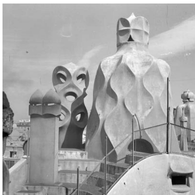
Joaquim Gomis. Vista de Xemeneies, badalots i torres de ventilació a la terrassa de la Pedrera, 1946. Fons Joaquim Gomis, dipositat a l'Arxiu Nacional de Catalunya.

Fons Joaquim Gomis, dipositat a l'Arxiu Nacional de Catalunya.