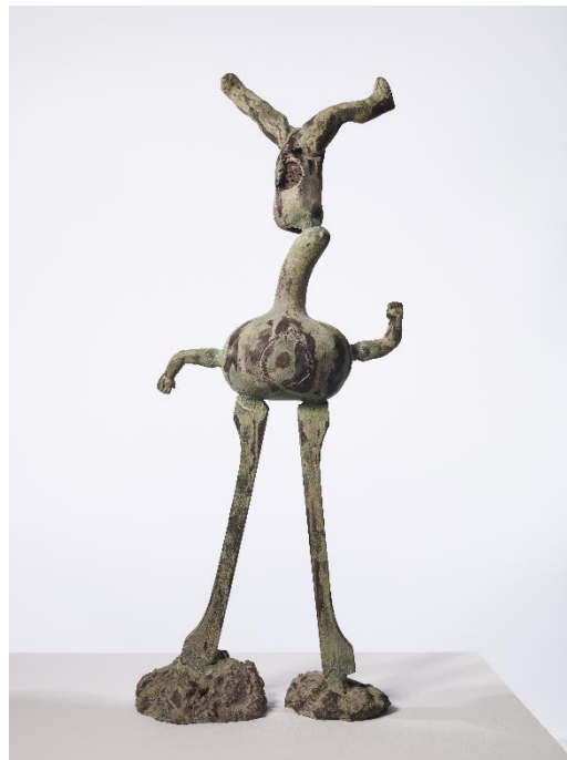
Joan Miró. L'equilibrista , 1969.