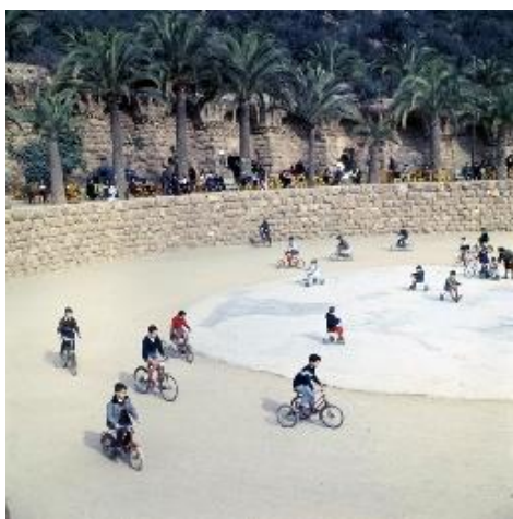
Joaquim Gomis. Vista de la plaça principal del Park Güell amb un grup de nens muntant en bicicleta, 1967.

Fons Joaquim Gomis, dipositat a l'Arxiu Nacional de Catalunya.