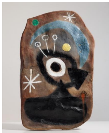
Joan Miró. Estela de doble cara , 1956.