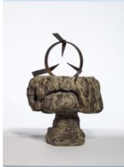
Joan Miró. Testa coronada , 1970.