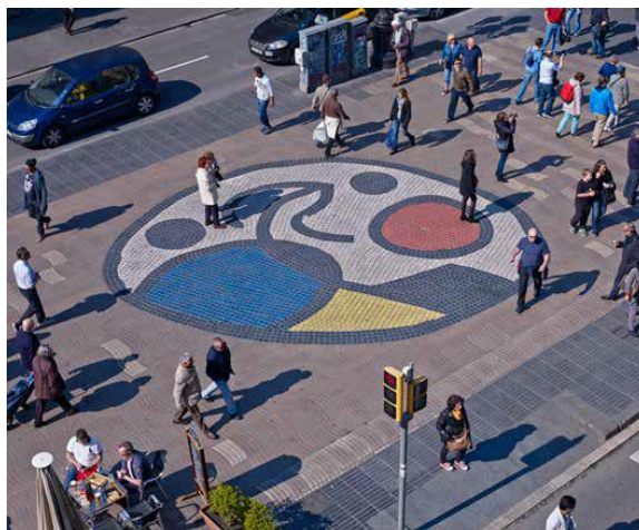
Joan Miró. Mosaic del Pla de l'Ós a la Rambla de Barcelona, 1976.