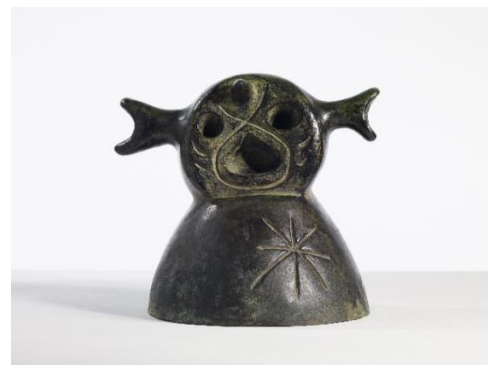
Joan Miró. Tête , 1949. Fundació Joan Miró, Barcelona.