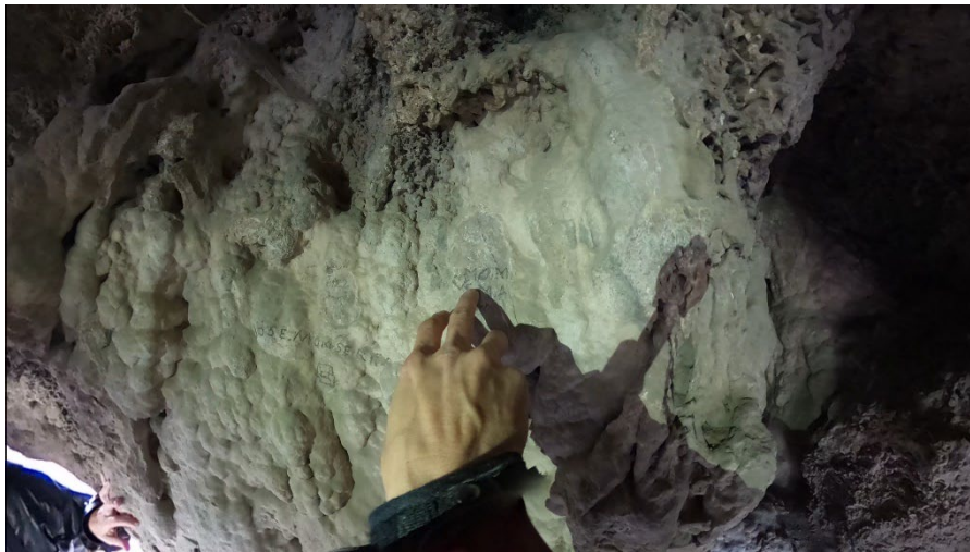
Bandolerismes , de Claudia Pagès. Cortesia de l'artista

Capellades, poble natal de l'artista, va adquirir un gran prestigi el segle XVIII en la producció de paper timbrat, que es va utilitzar sobretot per a documentació judicial i administrativa i que va servir d'instrument per a la identificació, la legitimació, la colonització, la propietat i el control. El vídeo que flanqueja el mur es va rodar en dues localitzacions de Capellades: el Museu Molí Paperer —que guarda un important fons patrimonial de paper timbrat— i l'Abric Romaní del Capelló —un jaciment arqueològic neandertal que conserva marques d'èpoques diverses gravades a les seves parets de roca. En paraules dels comissaris, «tant el museu com el barranc acumulen signes que es mouen en un espai ambigu entre la paraula i la imatge.»