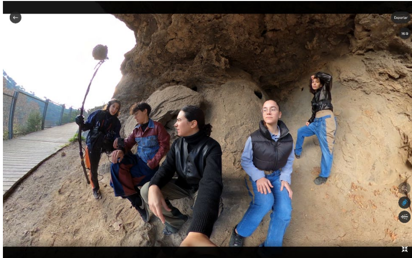
Bandolerismes , de Claudia Pagès. Cortesia de l'artista

Per a la mostra que obre el nou cicle de l'Espai 13, l'artista explora la història i la càrrega política de marques com ara les filigranes o les del paper timbrat. Pagès ha partit la sala en dues àrees, travessada per un mur de papers marcats amb filigranes creades per ella. A tots dos costats de la paret divisòria, dues pantalles encarades reproduïxen, amb alternança, un fragment de la mateixa peça audiovisual.